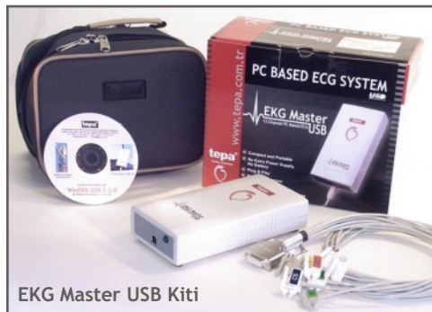
EKG Master USB Kiti