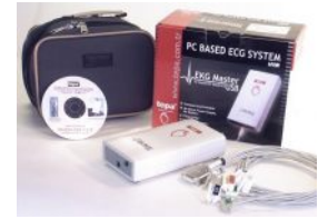
EKG Master USB Kiti