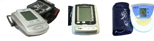
BD-3000S BF-180M SHB-100F