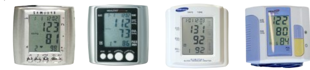
BW-325S SHB-200W SBM-200TA SHB-100W