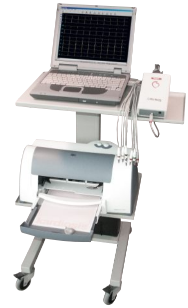
EKG Mater USB Sistemi EKG Master USB + Notebook PC + Hareketli masa + Yazıcı