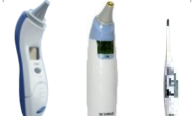
SET-150 SET-300 SDT-10A