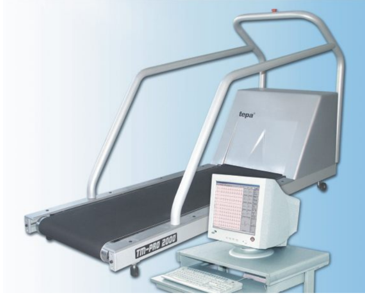
ars-Efor 12 kanallı EKG egzersiz sistemi

1987'den bu yana ülkemizde ve dünyada ilk kez bilgisayar tabanlı EKG ve Eforlu EKG sistemleri üreten TEPA kardiosis modeli ile ülke çapında tanınmıştır. Günümüzde ars-Efor ve EKG Master USB modelleri ile 12 kanallı EKG sistemlerini hizmetinize sunmaktadır. Elektronik tasarımı ve mekanik aksamı ile modern teknolojiyi uluslararası kalite standartlarında tıbbın hizmetine sunan ürünlerimiz, özgün yazılımı ile de güncel bilgisayar işletim sistemleri ile uyumludur.